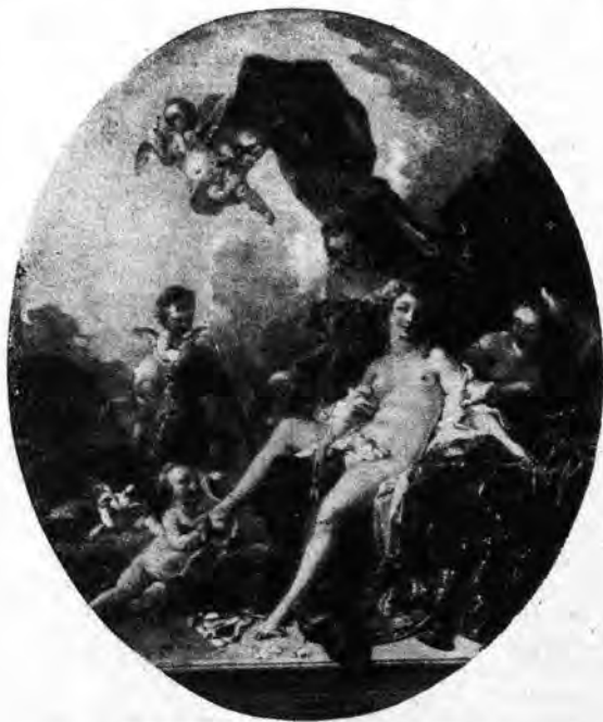
BOUCHER: LA TUALETO DE VENUS

Aŭdinte la virineto la vortojn de la sankta homo, mi-