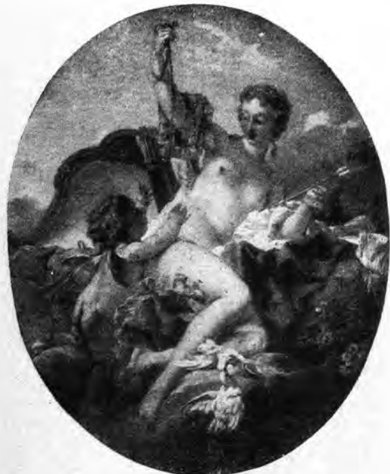
BOUCHER: VENUS KAJ CUPIDO