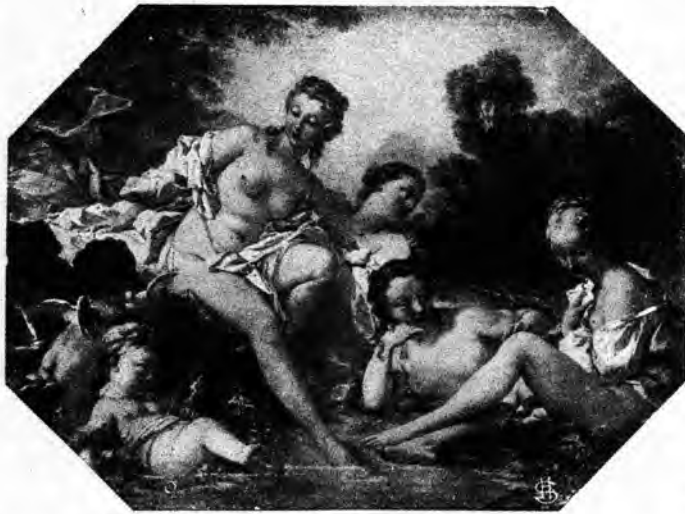
BOUCHER: SINBANANTAJ NIMFOJ

Izor aspektis vere komika. Li staris ĉe malantaŭo de azeno kaj tenis forte ĝian voston. La besto persistis obstine pri la plua trotado, dum Izor deziris halti iom por babiladi.